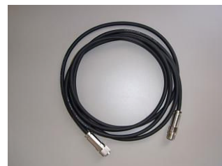
3m : 18,000 円 (税別) 5m : 24,000 円 (税別) 10m : 32,000 円 (税別) 15m : 38,000 円 (税別)