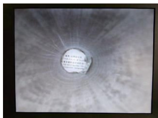
LED 照明:暗いパイプの内面 S U S パイプ 内径 33mm 長さ 20cm