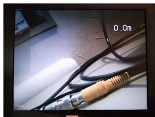
明るい室内 (LED OFF) 手前のコネクターまで 12cm 奥の壁まで 40cm