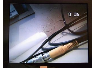
明るい室内 (LED OFF) 手前のコネクターまで 12cm 奥の壁まで 40cm