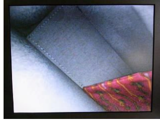
LED 照明：暗いカバンの内部 赤色のケースまで約 15cm カバンの端まで約 25cm