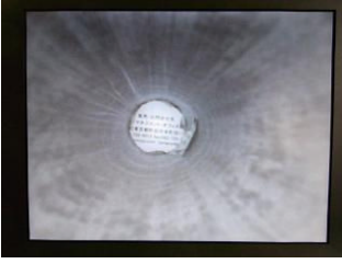
LED 照明：暗いパイプの内面 S U S パイプ 内径 33mm 長さ 20cm